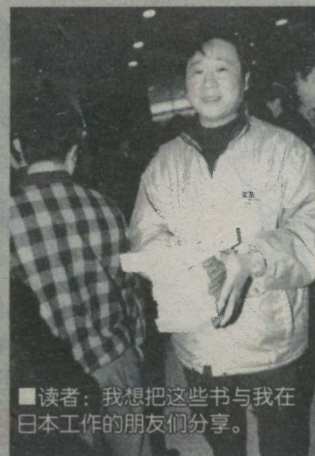
■读者:我想把这些书与我在日本工作的朋友们分享。